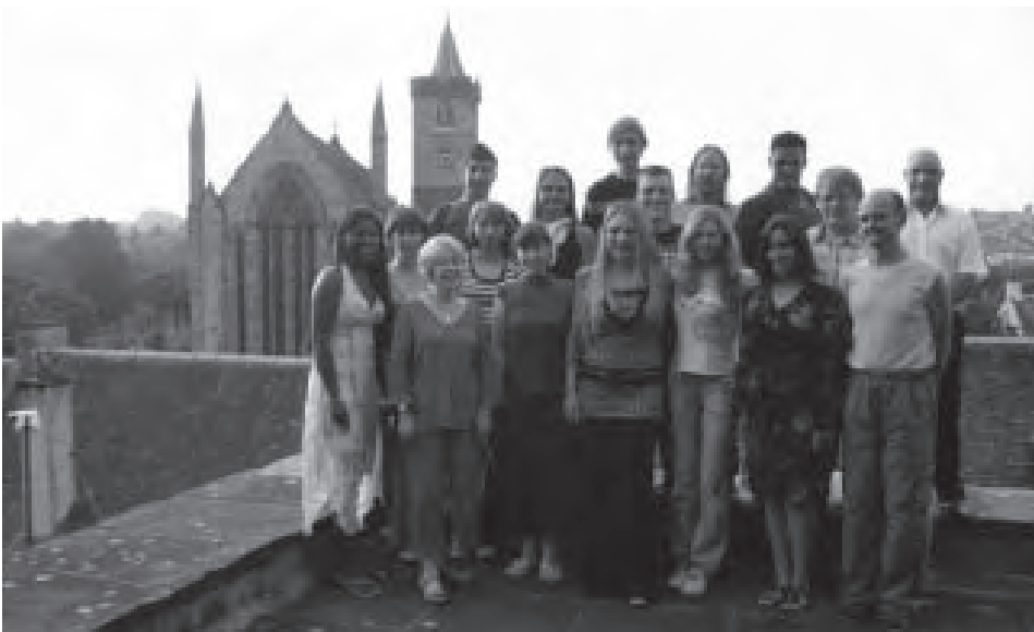
Účastníci workcampu před katedrálou v Dunblane

V souvislosti s dobrovolnictvím se často zdůrazňuje, aby dobrovolník byl vybaven co nejlepší angličtinou. Moje angličtina nebyla a dosud ještě není nejlepší, ale byl jsem nadšen přístupem kolegů. Přiznám se, že jsem měl obavu, abych nebyl za hlupáka, že tak