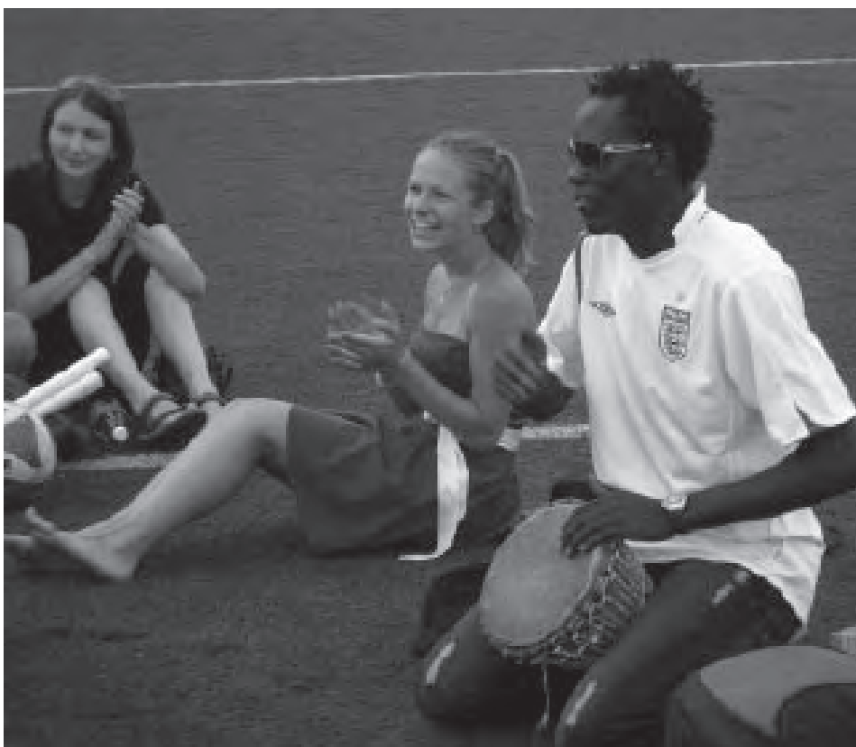
Spontánní africké jamování po jednom z fotbalových turnajů

Osobně jsem byla na Afričany hodně zvědavá. Ani jsem se tak netěšila (protože jsem věděla, že při svojí chabé znalosti angličtiny jim stejně moc nebudu rozumět), byla to opravdu hlavně zvědavost. Na jejich - pro nás hodně exotický - vzhled, mentalitu, chování... Poprvé jsme je potkali na chodbě ve škole, když přijeli. Bylo to vzrušující a zajímavé. Rázem bylo na chodbě pozdvižení. Vzájemně jsme se okukovali, my dost překvapené a zvědavě, oni asi taky, ale spíš mi připadali klidní, v pohodě. Někteří i celkem suverénní... To mě překvapilo. Čekala jsem, nevím proč, asi kvůli té situaci v Africe, že přijedou nasměle černoušci, kteří budou mít strach promluvit. Zní to asi blbě... Naproti tomu ale přijeli krásní, inteligentní a komunikativní lidé. Což je moc dobře. Člověk se tomu až diví, když vidí v televizi nebo dokumentech, které jsme během týdne viděli, tu smutnou situaci v Africe. Na prezentacích šlo poznat, že je to pro ně velmi citlivé a není se co divit. Já ale obdivuju, že i přesto všechno o tom