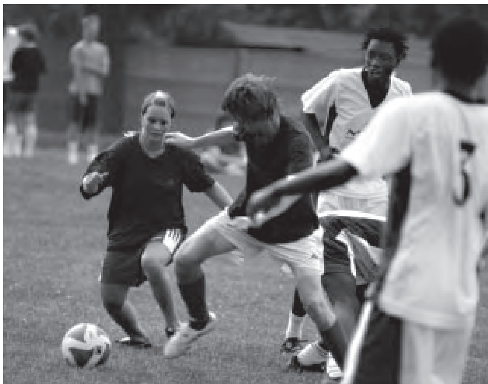
V zápalu boje na olomouckém turnaji

Smíšený fotbalový tým z nairobských slumů ve věku 16-18 let dostal už potřetí příležitost seznámit českou veřejnost trochu blížeji s tím, co znamená žít v rozvojové zemi na hranici absolutní chudoby. Zároveň ale mohli ukázat, že „slumy“ a „Afrika“ neznamena jen bídu, chudobu a beznaděj. Žijí tam mladí lidé s podobným potenciálem jako tady, jen nedostávají zdaleka tolik příležitostí ho uplatnit. Přinášíme několik ohlasů z české i keňské strany, jak vnímají Fotbal pro rozvoj jeho účastníci.