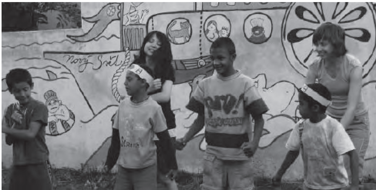
Příprava divadelního vystoupení