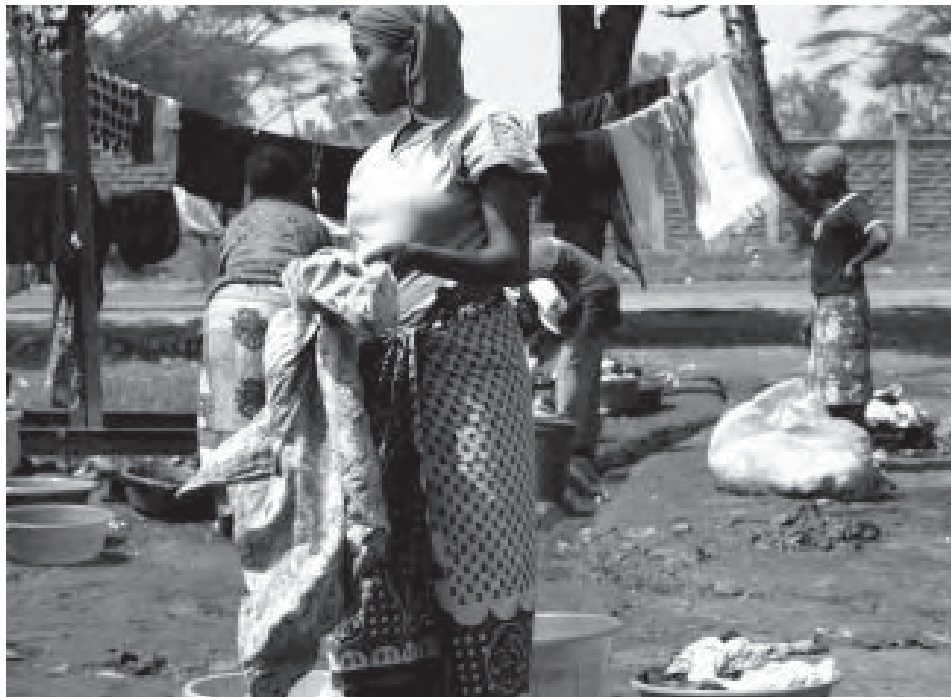
Ženy v táboře při praní prádla

Na okraji jednoho z největších keňských slumů Mathare vyrostl před sedmi měsíci stanový tábor keňského červeného kříže. Tábor Huruma byl vystavěn v důsledku násilí, které Keňu zasáhlo především v průběhu ledna letošního roku.