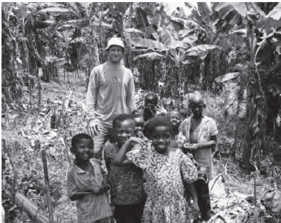
Ghanských dětí je moc a neustále se objevují nové a nové, aby si vás, obruní (výraz pro bělocha), prohlédly a hlavně osahaly.

S dobrovolnictvím jsem pár zkušeností měl. Ale s Afrikou? Vůbec. Afriku jsem vnímal jako Evropany silně poznamenaný kontinent, jehož původní obyvatelé mezi sebou válčí, trpí hladomory, a když náhodou ani jedno, tak před něčím takovým aspoň utíkají. Vybral jsem si tedy pro jistotu Ghanu, Afriku pro začátečníky, kde žádné extrémní situace nehrozily. S údivem jsem našel lidi smějící se, zpívající, tancující, oslavující život.