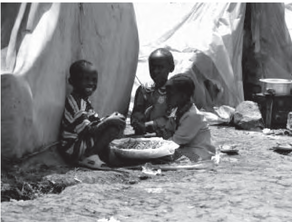
Není to legrace. (Děti připravují zeleninu na oběd)